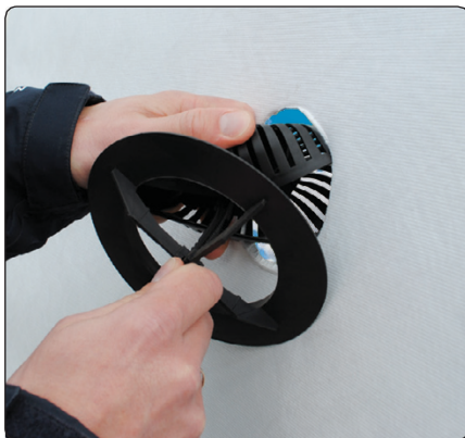
Pres ventilstudsens sammen, så undertaget er placeret mellem dæksel og underdel