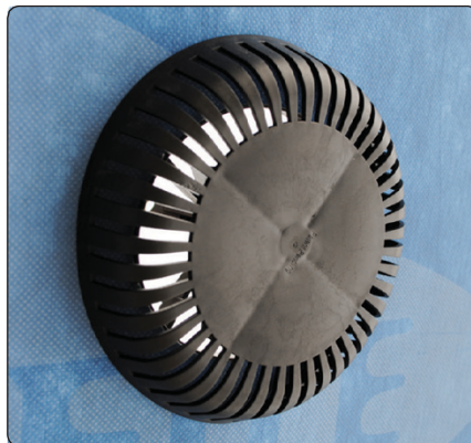
Ventilstuds færdigmonteret set udefra

KimaAir INSIDE/OUT Ventilstuds er til udluftning af kolde tagrum. Den monteres hurtigt og effektivt i undertaget indefra. Dette er en stor fordel, da det ofte er besværligt at eftermontere ventilstuds udefra.