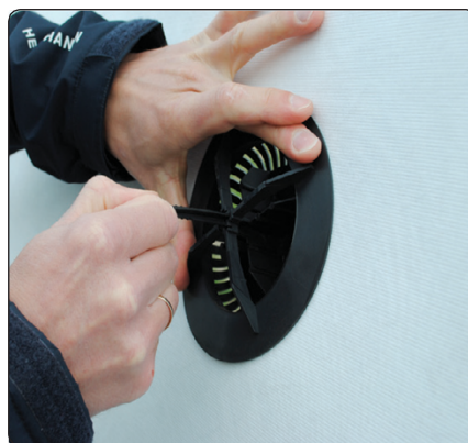
Dæksel trækkes stramt ned til