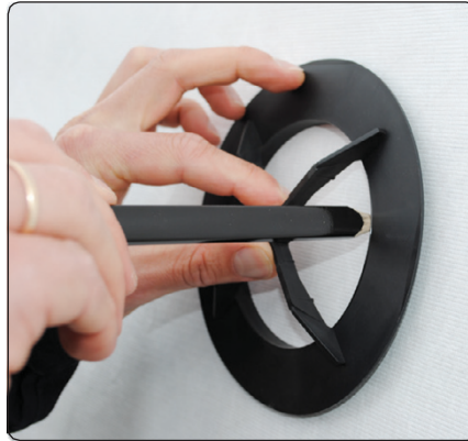
Marker og skær hul i undertaget