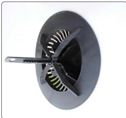
Ventilstuds færdigmonteret set indefra